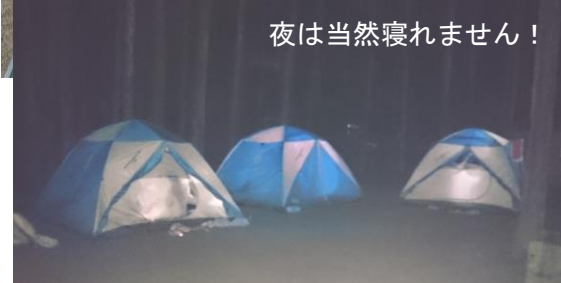
夜は当然寝れません！