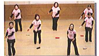
ダンベル健康体操