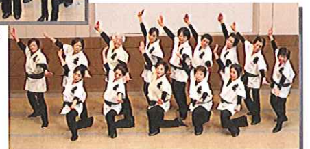
レクリエーションダンス教室