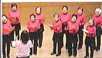
コールエレガンス