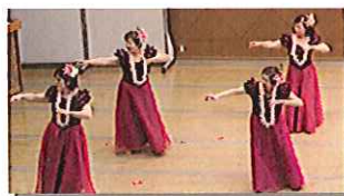
レイフラワー雑賀