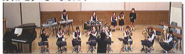
さいかメロディーズ

2月4日(土)スティックビルにて開催されました。たくさんのお客様にお越しいただき、盛会の内に終わることができました。ご出演いただきました皆様、ご来場いただきました皆様、本当にありがとうございました!