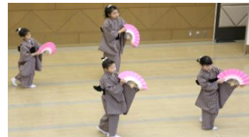
美月波流 子ども舞踊