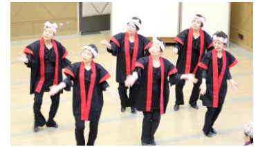
雑賀 フォークダンス