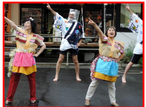
チーム培塾によるオープニングダンス♪