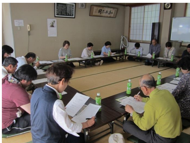
生活環境保全推進会議

生活環境保全推進員・協力員の皆さま、早朝より熱心に見廻り活動いただき、 有難うございました。