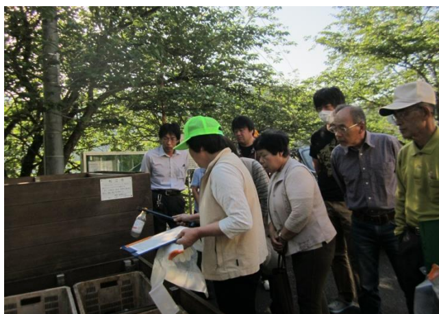
リサイクルステーションの見廻り調査