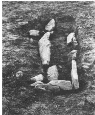
写真：4号墳の箱式石棺