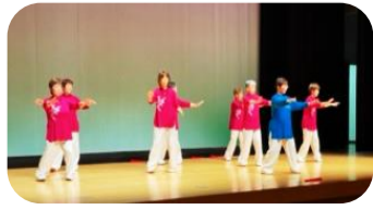
大庭公民館サークルの皆さんの発表の様子

11月19日(土)松南ブロック学習発表会を八雲アルバホールにてコロナウイルス感染予防対策をとり、3年ぶりに開催いたしました。当日は天気にも恵まれ、松南ブロック6公民館のサークル19団体の皆さまによる発表会となりました。また、有志の方々によるイベントもあり、多くの皆様にご来場いただき、盛会裏に終了いたしました。