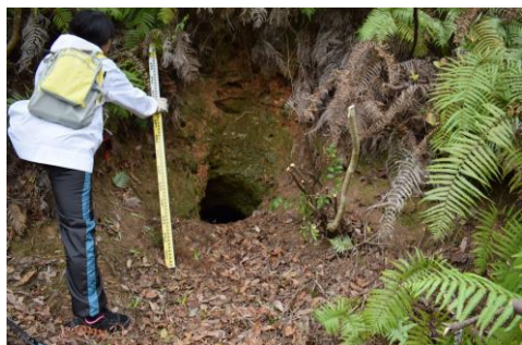
右写真 開口している横穴の様子