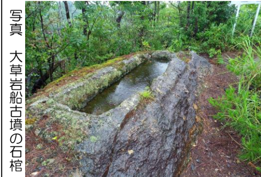
写真 大草岩船古墳の石棺

古墳は全長25.2mの前方後方墳で、石棺は中心部ではなく、後方部のやや西南に位置しています。この石棺は舟形石棺と呼ばれるもので、もともとここにあった岩盤をくり抜いてつくられた石棺で、蓋があったはずですが失われていきます。残された石棺には、蓋とうまく合うように、形が成形されています。