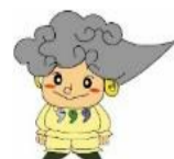
風土記の丘キャラクター くふむん