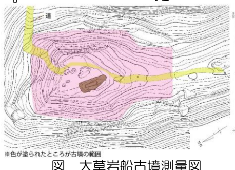
※色で塗られたところが古墳の範囲 図 大草岩船古墳測量図