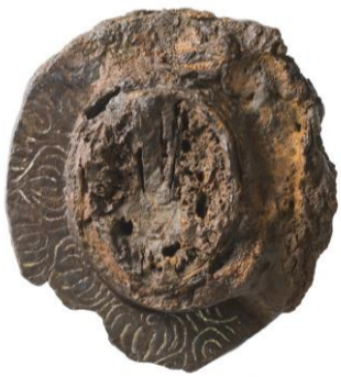
写真 銀象嵌が施された大刀の鏝 （島根大学考古学研究室蔵）

その他、島根大学にも採集品が保管されており、近年その中の鉄製大刀の鏝に象嵌文様が施されているのが確認されました。象嵌とは一つの素材に別の素材をはめ込む技法で、この大刀は銀象嵌と呼ばれ、鉄製の大刀に銀の糸を埋め込み、文様としたものです。岡田山1号墳の「額田部臣」銘文入大刀も同様の手法で文字が記されたものです。