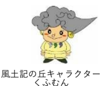
風土記の丘キャラクター くらむん