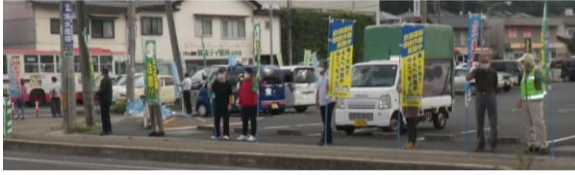
大庭地区自治協会・大庭地区交通対策協議会

これからも、一人ひとりが心がけ、事故のない安全安心な大庭のまちづくりにご協力をお願い申し上げます。