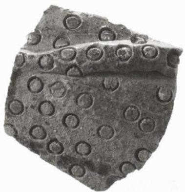
皮袋形須恵器（東淵寺古墳）

東淵寺古墳で見つかったものは、表面には竹管文が施されていますが、破片のため全体像が不明です。岩屋後古墳で見つかったものはある程度大きな破片ですので、全体像が推定されています。古墳時代といっても、大陸との交流など幅広い国際性がうかがえます。