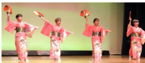
大庭おどりクラブ