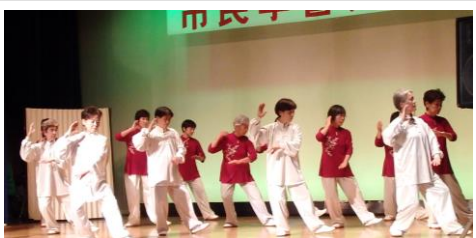
気功・太極拳 さつき会