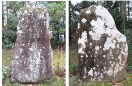
写真 右：千家尊福揮毫 左：北島齊孝揮毫

が、「有」という字は十月を一字にした形で、神有(在)月を示しています。この御神紋は眞名井神社や神魂神社も同様で、国造家で大変深いゆかりを持っている神社です。