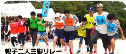
親子二人三脚リレー