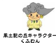
風土記の丘キャラクター くみむん

日時：10月5日(土)～11月16日(土) 内容：出雲国府跡、国分寺跡など9ヶ所を好きな時にめぐるクイズラリー。参加賞あり。詳しくは風土記の丘HPへ