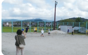
淞南高校学生さんとの交流