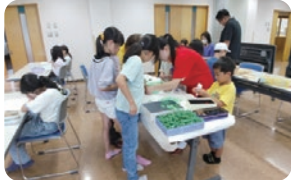
はらぺこあおむしの製作