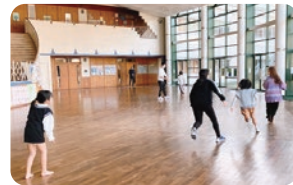
お兄さんお姉さんとの遊びの時間