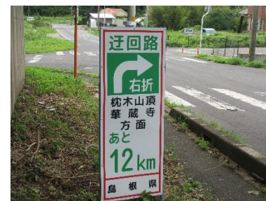
迂回標示看板～東持田～

7月12日(月)の集中豪雨により県道枕木線(本庄)が通行止めになり、林道澄水山(しんじさん)線・林道北山線が枕木山方面への迂回路となっています。県道の被害が10箇所程度に及ぶことから復旧のめどが立っていません。