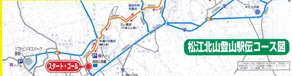
松江北山登山駅伝コース図