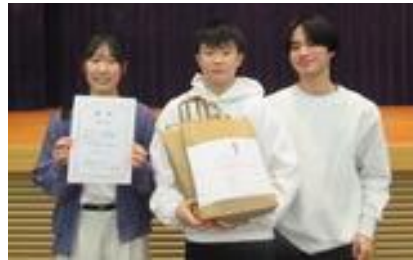
第2位：アンタッチャボ A