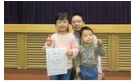
第3位：チーム明日香