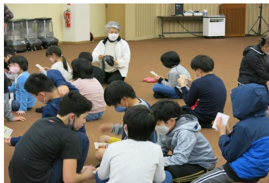
3月8日 お別れ会（ビンゴゲーム）