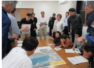
七類地区での様子