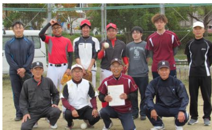
優勝した七類・千酌・森山連合チーム