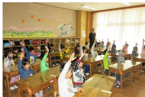
美保関小学校の新 1 年生たち