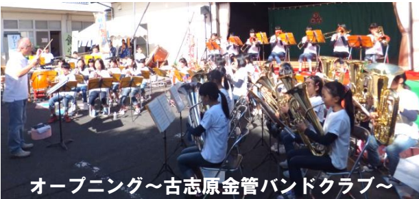
オープニング～古志原金管バンドクラブ～