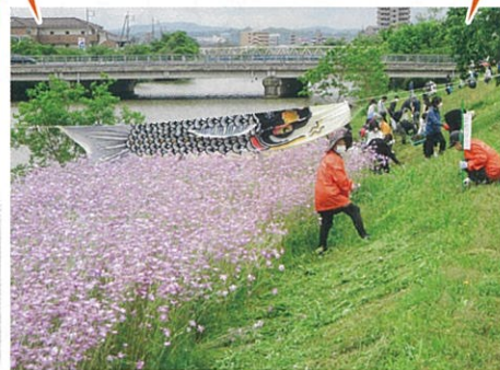
朝酌川フラワープロジェクト