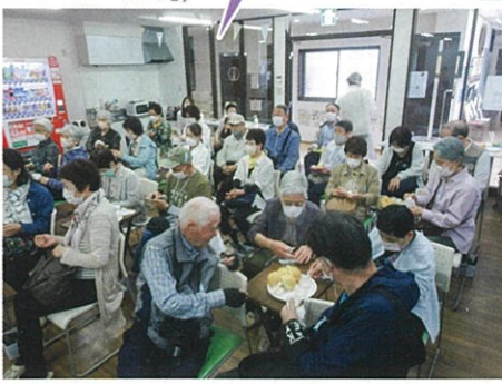
八天堂で焼き立てのパンを試食