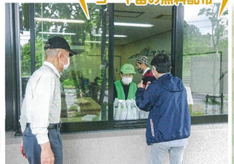
ゴーヤ苗の無料配布