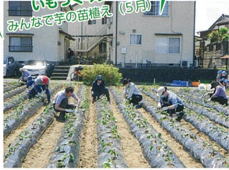
いもづくり交流 みんなで芋の苗植え (5月)