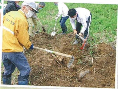
コスモス畑予定地から何と土管が... (4月)