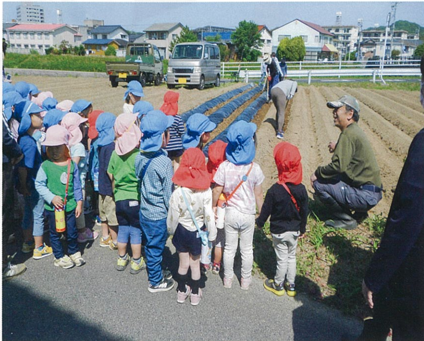
芋畑で地域の方との交流

子ども達は川津のいろいろな場へ行き、心や体で体験をする中で、いつも地域の方の温かい心に触れています。地域の方に出会い、かわかることは子どもの成長にとってどんなにすてきなことだろうと