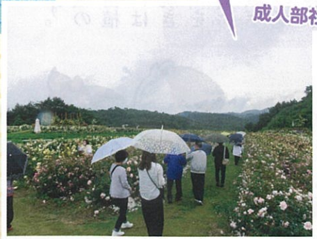
世羅高原花の森はあいにくの雨