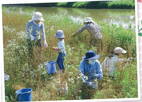
ムギナデシコの種を採取 (6月)