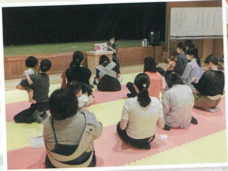
絵本の読み聞かせに集中 (5月)