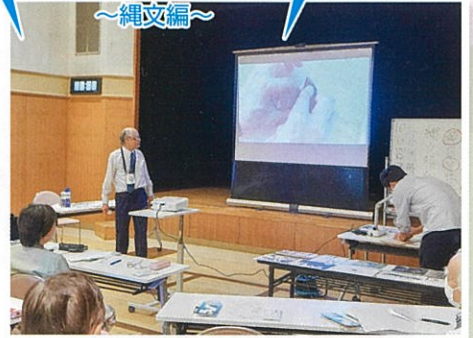
川津歴史講座 ～縄文編～