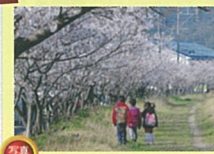
仲良し3兄弟のお花見 大石 幹生さま