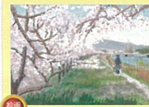
犬の散歩 金井 和夫さま