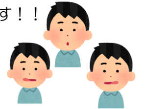
《口腔体操のイメージ》