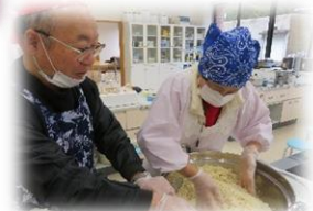
《みそづくりの様子》