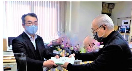
《令和3年11月 署名提出の様子》