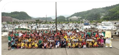
川から海へ大航海 in 鹿島2016