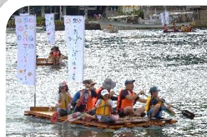
川から海へ大航海 in 鹿島2019