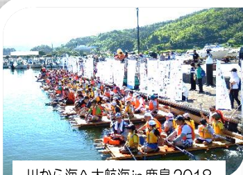
川から海へ大航海 in 鹿島2018