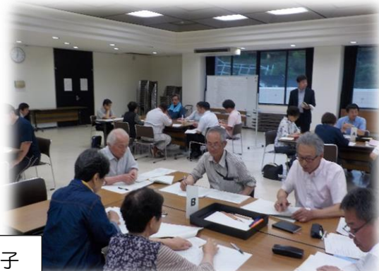
まちづくり会議の様子