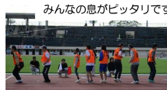
みんなでジャンプ!! みんなの息がピッタリです