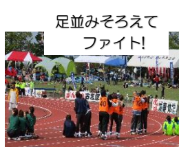
足並みそろえて ファイト!