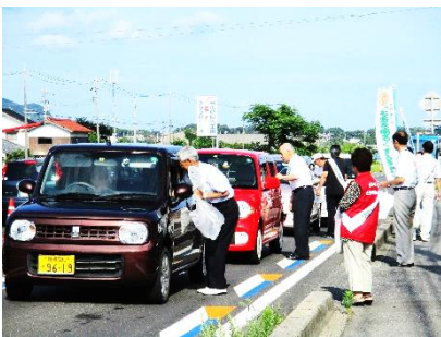
【本郷橋付近での街頭活動の様子】