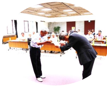
【←メッセージ伝達式】