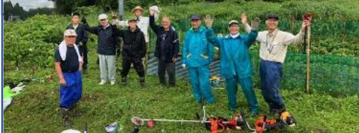
7月24日（金） 第1回草刈り 雨の中がんばりました

10月4日（日）に収穫前の第2回草刈りをします。 現在、花が咲き、コットンボールが付き始めています。 10月後半には棉やサツマイモの収穫を予定しています。来月号で募集したいと思っています。