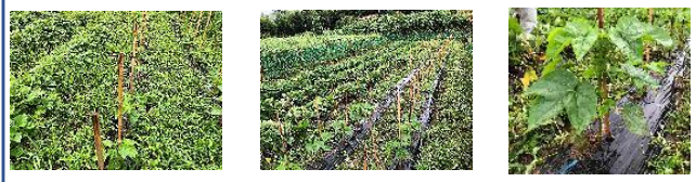
Befor草刈前 ⇒ After草刈後 棉も40cmに