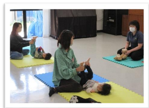
令和5年度はじめましての会「リトミック」