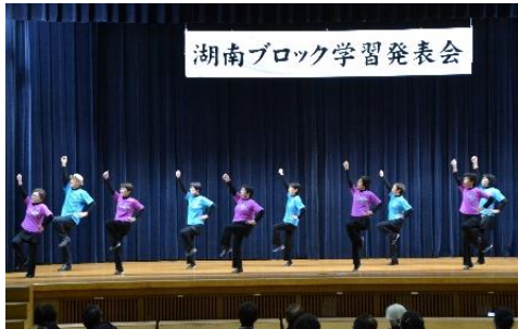
☞ スパンコール(忌部フォークダンス)