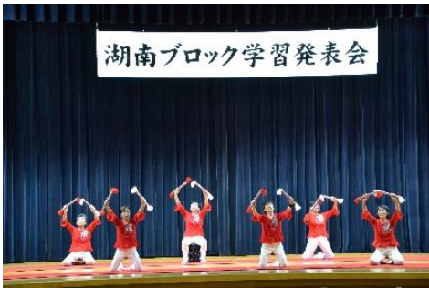
☞ なでしこ (銭太鼓)