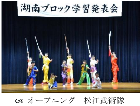
☞ オープニング 松江武術隊

11月30日(土)、忌部・乃木・玉湯・宍道公民館合同の学習発表会を玉湯公民館で開催いたしました。 天候にも恵まれ、たくさんの方にご来場いただきました。ステージ発表・作品展示とも昨年よりもたくさんの方にご参加いただき盛会となりました。ご来場、ご協力いただいた皆さまありがとうございました。