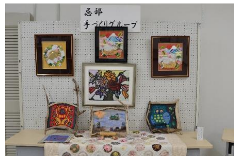
☞ 手づくりグループ