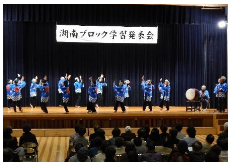
☞ 忌部盆踊り おどり隊(たい!)