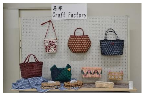
☞ craft factory