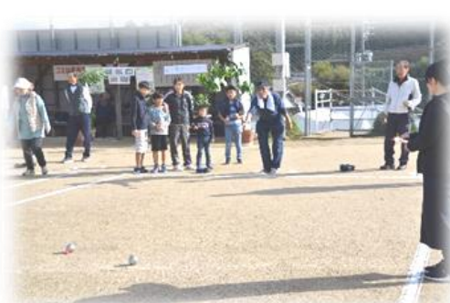
町民ペタンク大会