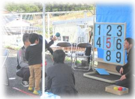
子ども遊びコーナー