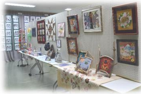
サークル展示コーナー