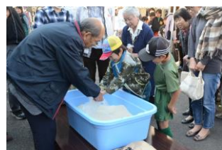
新米のすくい取り