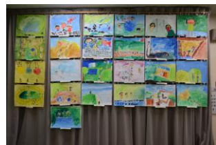
作品展示コーナー

今年の文化祭は、天候にも恵まれ多くの皆様にご来場いただき、盛大に開催できましたことを深く感謝いたします。また、ステージ発表・展示・テント村への出店等々、ご協力いただきました皆様方に厚くお礼申し上げます。