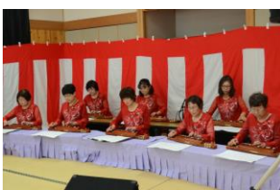
サークル発表 (大正琴 華音)