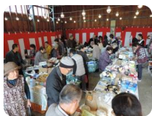
バザー会場の様子

売上総額 158,000 円 (バザー99,500 円・団子 58,500 円)