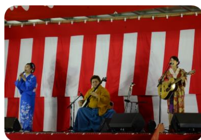
六子と一字川 スペシャルライブ