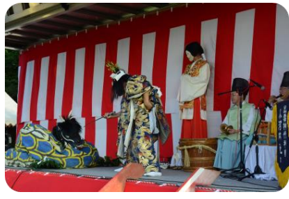
小河内神楽社中「箆乃川大蛇」