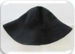
高原まつりの忘れ物

なお、9月末迄に持ち主が見つからない場合はこちらで処分させていただきますので、ご了承ください。