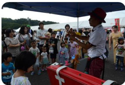
子どもに大人気!!バルーンアートプレゼント

7月29日（土）忌部自然休養村で第30回忌部高原まつりが開催されました。天候にも恵まれ多数の方にご来場いただき、盛会となりましたこと御礼申し上げます。また、開催にあたりご協力いただきました皆様方に心から感謝いたします。ありがとうございました。