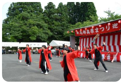
南中ソーラン踊り隊 絆の皆さん