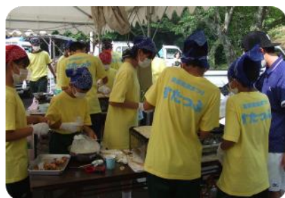
中高生・OBもボランティアで大活躍