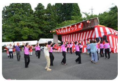
会場の皆さんと一緒に盛り上がりました!!