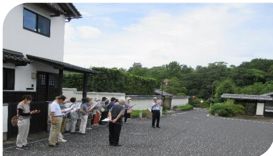
7/15 文化教室「塩見縄手・武家屋敷・市役所新庁舎見学」