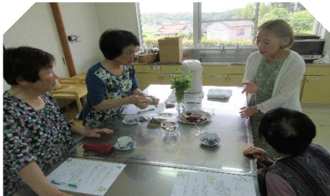
7/4 文化教室「ハーブティブレンドの入れ方講座」