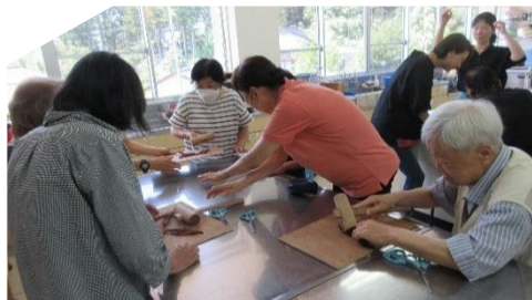
7/21 環境・美化活動「リサイクル研修 紙すき体験」