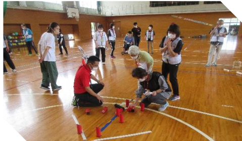
6/26 世代間交流事業「モルック体験交流会」