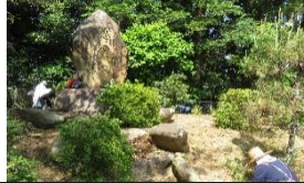
5/17(水)第1回花壇整備・慰霊碑・公民館周辺清掃