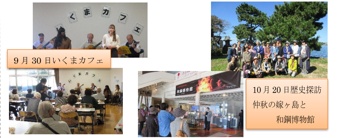
9月30日いくまカフェ