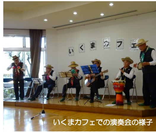
いくまカフェでの演奏会の様子