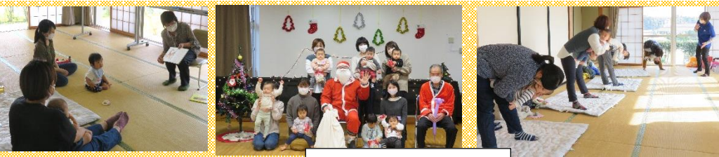
令和3年度活動写真

今年度は親子体操や絵本の読み聞かせ・クリスマス会やチャイルドシート安全着用点検などを行いました! 来年度も楽しい企画を考えておりますので、お気軽にお越しください!