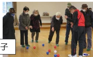
地区スポーツ大会 様子