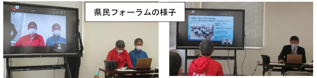
県民フォーラムの様子