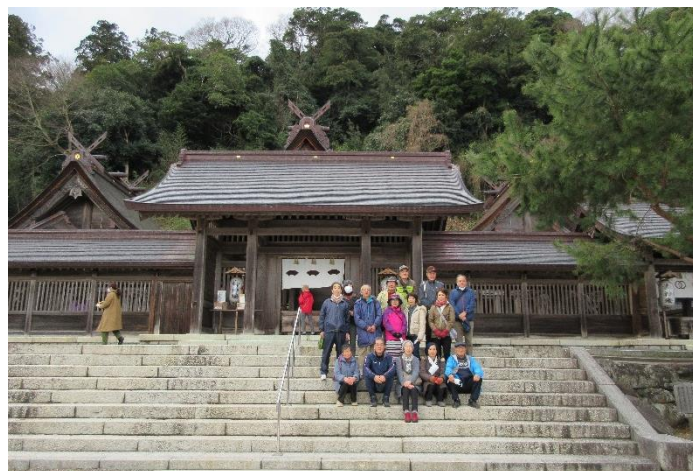
1/7(金)新春ウォーキング(佐太神社)