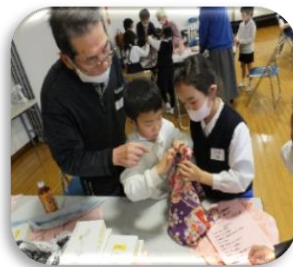
12/23(木)世代間交流事業 「ふろしき包みで リースづくり」