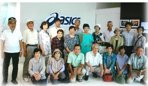
令和元年9月 地域探訪