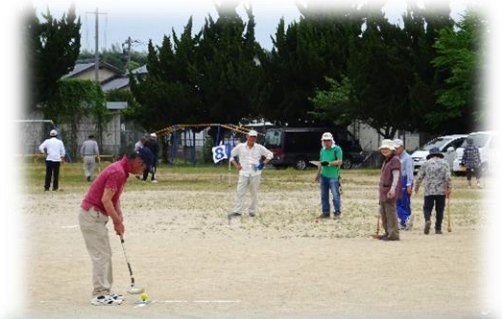
令和元年5月 春季スポーツ大会