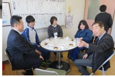
楽しいお話も聞かせて頂きました!