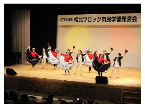
ジャストスマイル(ラウンドダンス)