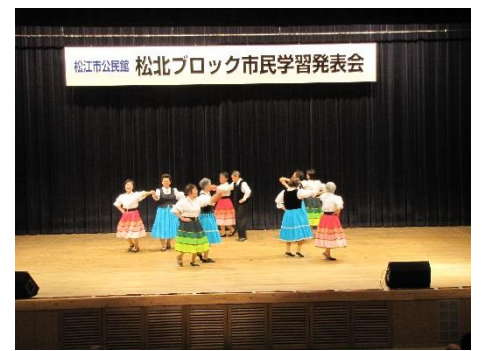
生馬フォークダンス教室