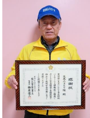
生馬みまもり隊 様