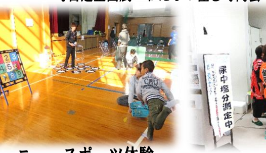
ニュースポーツ体験