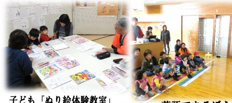
子ども「ぬり絵体験教室」