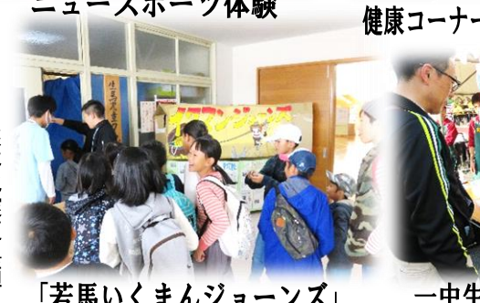
「若馬いくまんジョーズ」