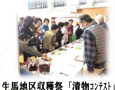
生馬地区収穫祭「漬物コンテスト」