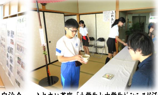
ふれあい茶席「小学生と中学生ボランティアが活躍」