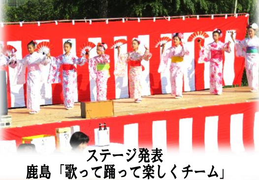
ステージ発表 鹿島「歌って踊って楽しくチーム」