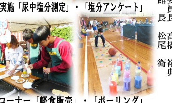
一中生コーナー「軽食販売」・「ボーリング」