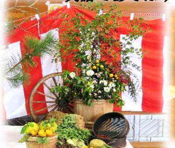
農政会議「農の生け花」 優勝 上佐陀町内会