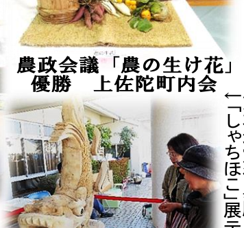
熊本地震復興願う 「しやちほ」展示