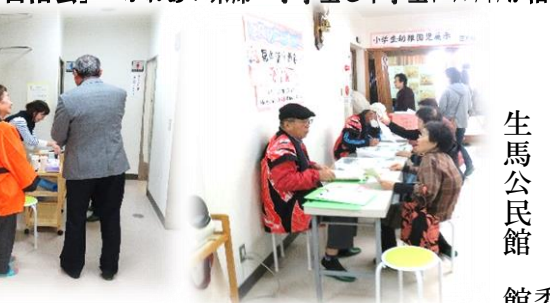
健康コーナー実施「尿中塩分測定」・「塩分アンケート」