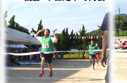
年齢別リレー 優勝 下佐陀下町内会