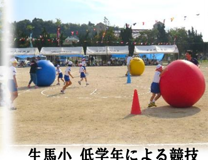
生馬小 低学年による競技 ぐるぐる ゴーロゴロ