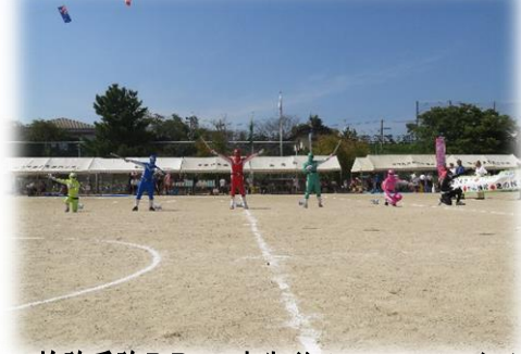
検診受診PR 一中生ボランティアによる「5代目 生馬地区健康戦隊ケンシンジャー」