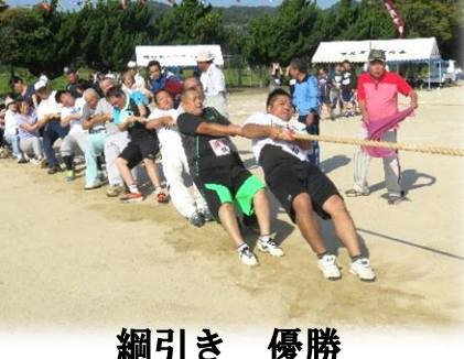
綱引き 優勝 浜佐田灘町内会 (15連覇)