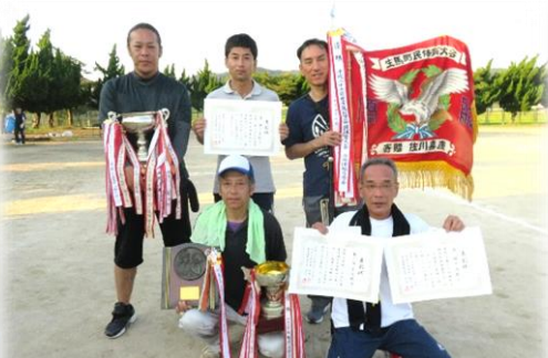
第64回町民体育大会 優勝 下佐陀下町内会