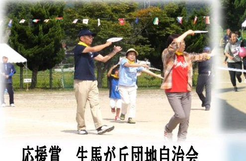
応援賞 生馬が丘団地自治会