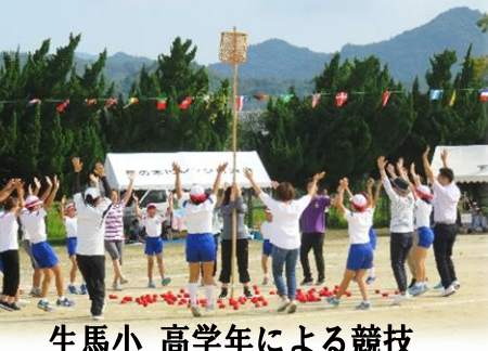
生馬小 高学年による競技 たまロチカ ~ダンス&シュート~