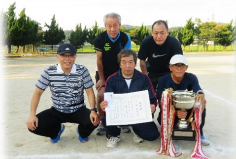
総合成績 優勝 湊苑団地自治会