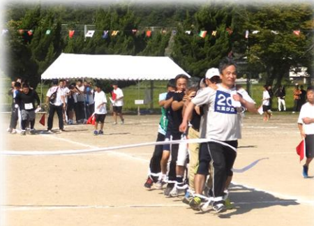
むかで競走 優勝 生馬が丘団地自治会