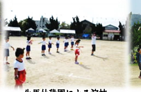
生馬幼稚園による演技