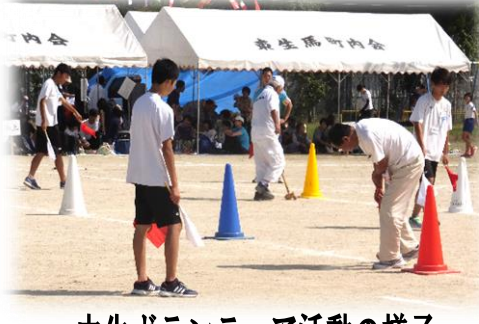
一中生ボランティア活動の様子