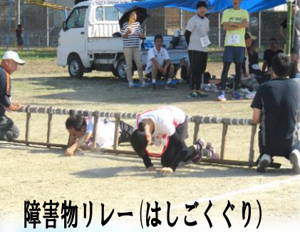
障害物リレー (はしごくぐり)