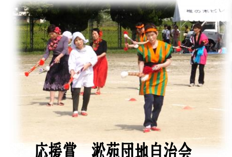
応援賞 湊苑団地自治会