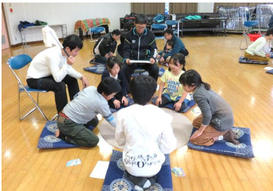
今年も白熱していました!!