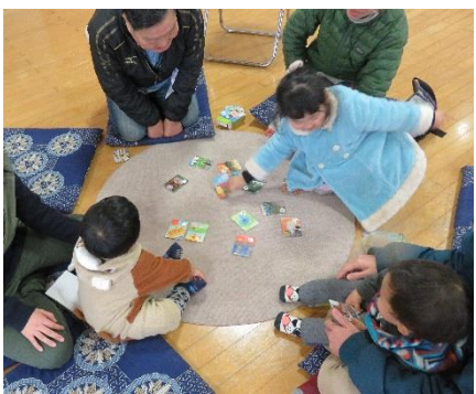
小さい子チームもやりました♡