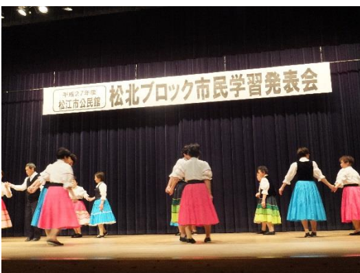
生馬フォークダンス教室