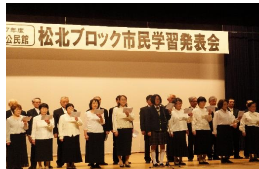
清吟堂吟友会 松江ブロック

生馬地区からはステージ発表に「琴修会(大正琴)」、「詩吟教室」、「若菜会(民謡踊り)」、「フォークダンス教室」の皆さんにご出演いただきました。ご出演、ご来場頂きました皆さんの皆様ありがとうございました。