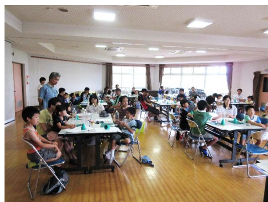
ペットボトルロケット制作中